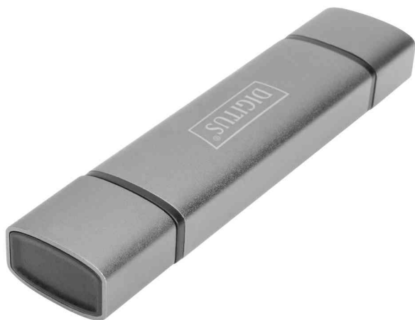
Dual Card Reader Hub USB-C / USB 3.0