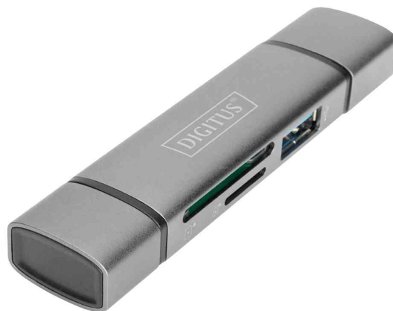
Dual Card Reader Hub USB-C / USB 3.0