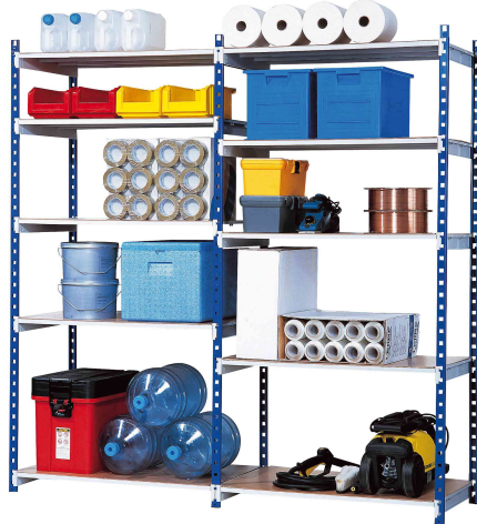
Lagerregal "RANG'ECO" (Lieferung unbestückt)

- zur Aufbewahrung von schwerem Lagergut