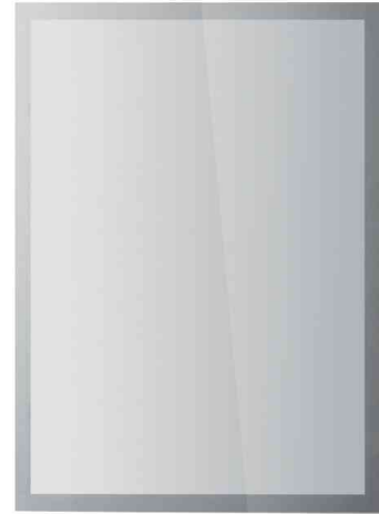
DURAFRAME SUN, silber