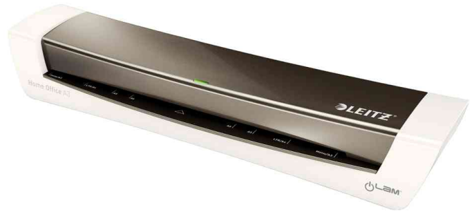
Laminiergerät iLAM Home Office A3