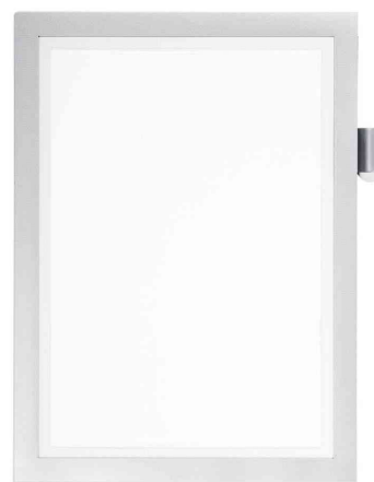
Magnetrahmen DURAFRAME NOTE, silber