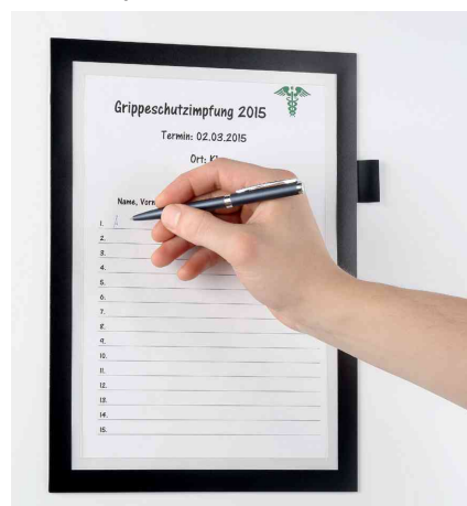
Direktes Beschriften des Dokuments