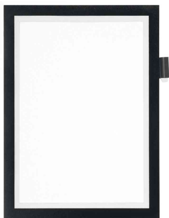
Magnetrahmen DURAFRAME NOTE, schwarz