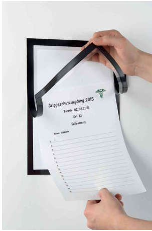
Mit magnetischer Vorderseite