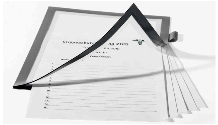
Füllhöhe bis zu 5 Blatt 80 g/qm