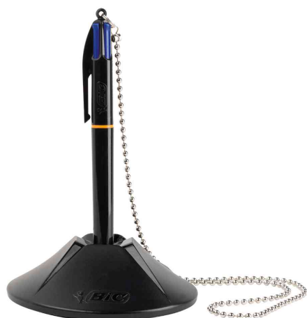
Kugelschreiber-Ständer 4 Colours Counter Pen