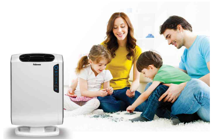
Luftreiniger AeraMax DX55, Anwendung