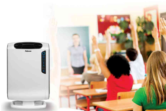
Luftreiniger AeraMax DX55, Anwendung