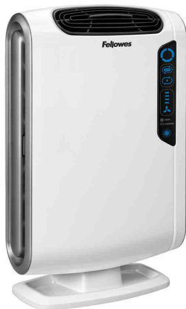
Luftreiniger AeraMax DX55