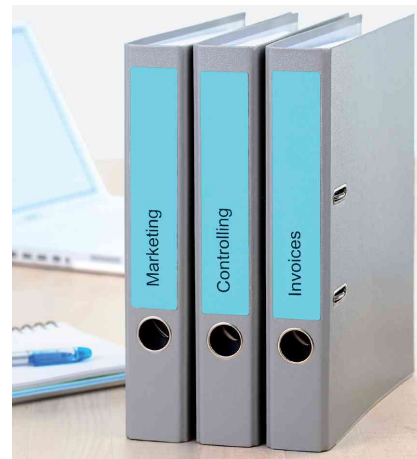
Orderrücken-Etiketten SPECIAL, Anwendung