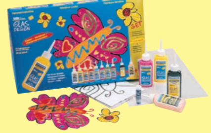
42752 Window Color GLAS DESIGN Set mit extra viel Farbe