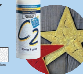
Hobby Line KrakeleemEDIUM