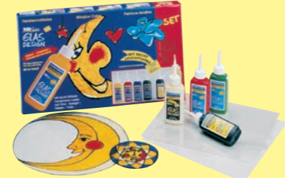
42751 Window Color GLAS DESIGN Set mit Nachtleuchtfarbe