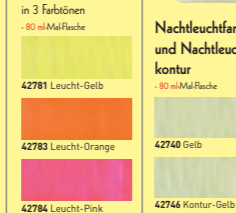
42781 Leucht-Gelb 42783 Leucht-Orange 42784 Leucht-Pink