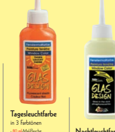
Tagesleuchtfarbe in 3 Farbblöcken - 80 ml Malflache