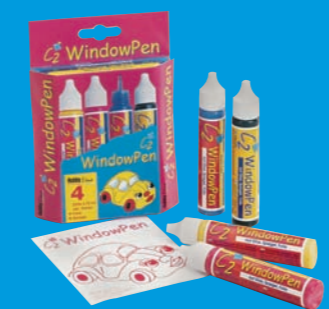
41150 C2 WindowPen Stifte-Set