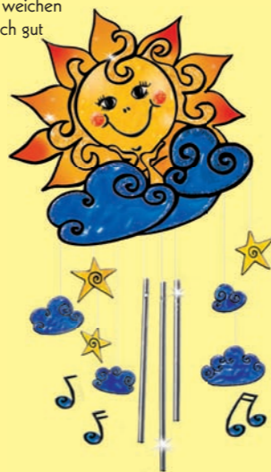
Hobby Line Window Color GLAS DESIGN mit Struktur-Effekt in 37 Farbblöcken - 80 ml Malflache (Art. Nr. 427...)

Einen Tag nach dem Malen kann das Bild vorsichtig vom Untergrund gelöst werden. Das Bild haftet von selbst. Bei mehrmaliger Verwendung sollte das Bild leicht angefeuchtet werden.