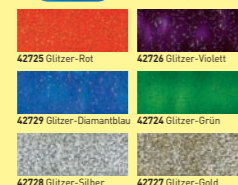
42725 Glitzer-Rot 42726 Glitzer-Violett 42729 Glitzer-Diamantblau 42724 Glitzer-Grün 42728 Glitzer-Silber 42727 Glitzer-Gold