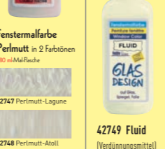
42747 Perlmutter-Lagune 42748 Perlmutter-Atoll