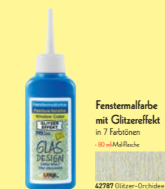
Fenstermalfarbe mit Glitzereffekt in 7 Farbblöcken - 80 ml Malflache