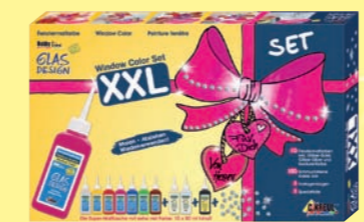
42849 Window Color GLAS DESIGN Set „XXL“