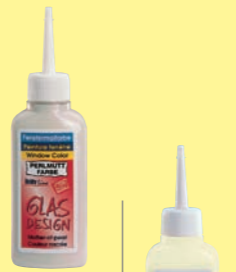
Fenstermalfarbe Perlmutt in 2 Farbblöcken - 80 ml Malflache