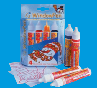
41153 C2 WindowPen Stifte-Set „Schneemann“