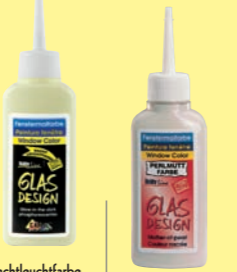
Nachtleuchtfarbe und Nachtleucht-kontur in 2 Farbblöcken - 80 ml Malflache