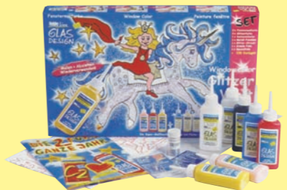
42844 Window Color GLAS DESIGN Set „Glitzerwelt“