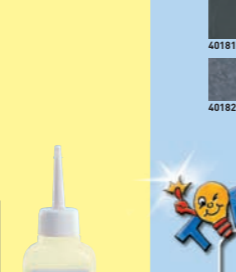
42749 Fluid (Verdünnungsmittel)