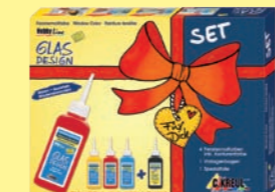
42848 Window Color GLAS DESIGN Set „Celebration“