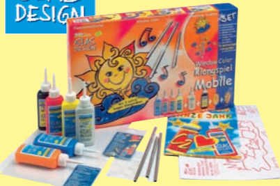
42845 Window Color GLAS DESIGN Set „Klangspiel Mobile“