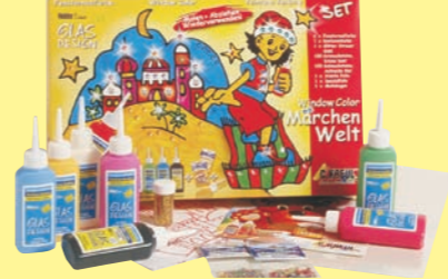
42846 Window Color GLAS DESIGN Set „Märchenwelt“