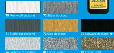
75 Reinweiß deckend 73 Silber deckend 71 Blaufarbig deckend 72 Gold deckend 74 Schwarz deckend 76 Farblos transparent 85 Pitter-Silber 86 Pitter-Gold