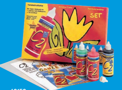
40150 Window Color C2 GLAS DESIGN Set