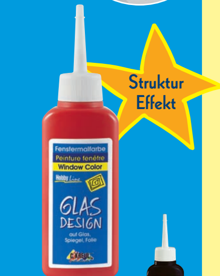
Konturenfarbe in 8 Farbblöcken - 80 ml Malflache (Art. Nr. 427...) - auch in 150 ml Nachfüll-Flache (Art. Nr. 429...)