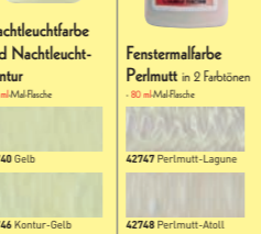
42740 Gelb 42744 Kontur-Gelb