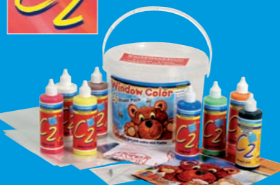
40151 Window Color C2 Set „Power-Pack“