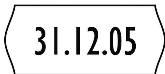
Etikett für Preisauszeichner, 1-zeilig

• Sicherheitsstanzung und hochwertige Etikettenmaterialien • universell einsetzbar in Handauszeichnern von Meto, Contact, Tove SP-Geräten • Abgabe nur in ganzen VE's • 1-zeilige Etiketten: 1.500 Etiketten pro Rolle • im Blisterpack: VE = 4 Rollen • im Karton: VE = 10 Rollen • 2-zeilige Etiketten: 1.200 Etiketten pro Rolle • im Blisterpack: VE = 4 Rollen • im Karton: VE = 10 Rollen